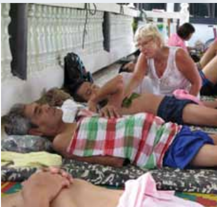
Kruidenbehandeling en aandacht, holistisch.

De monnik die deze techniek ontwikkelde is ongeveer 20 jaar geleden zijn moeder, die gedeeltelijk verlamd was, gaan behandelen. Het was zo bijzonder hoe goed ze reageerde op deze behandeling. Er kwamen steeds meer mensen naar hem toe die behandeld wilde worden en steeds meer mensen genas hij van hun kwaal. Toen werd hij monnik en begon heel kleinschalig, primitief en met heel veel liefde in zijn tempel te werken met deze technieken. Om meer patiënten te behandelen ging hij meer masseurs opleiden. Dit alles groeide uit tot dit prachtige centrum wat bestaat van donaties. Er werken nu meer dan 35 mensen (excl. familie en vrienden die assisteren bij de behandelingen), er worden wel 70 mensen per dag behandeld.